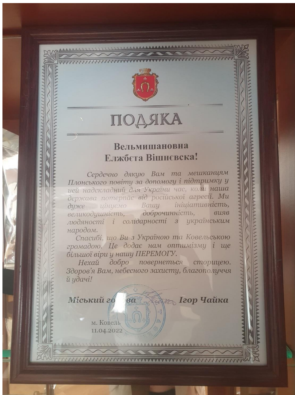
Podziękowania od mieszkańców Kovla

W międzyczasie przekazano również obywatelom Ukrainy, którzy nadal pozostali na terenie swojego kraju, leki, opatrunki, koce, podgrzewacze oraz produkty typu instant, które będą przydatne do przygotowania w różnych warunkach.